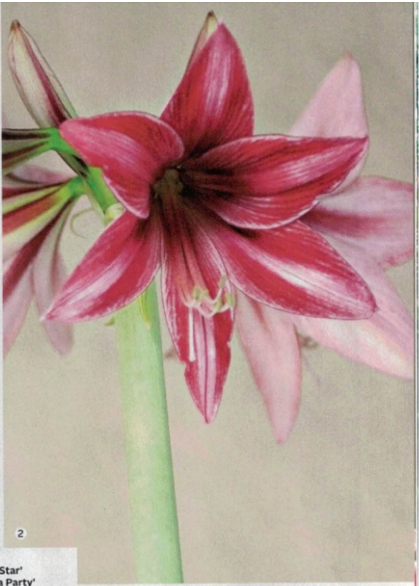
1. 'Jungle Star' 2. 'Pyjama Party' 3. 'Chico' 4. Tuntematon lajike